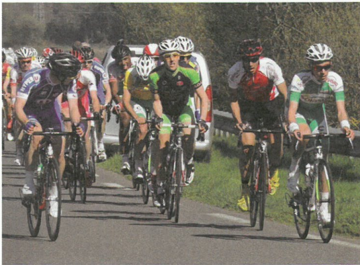
Au Gouray, les mollets et les cuisses sont mis à rude épreuve.